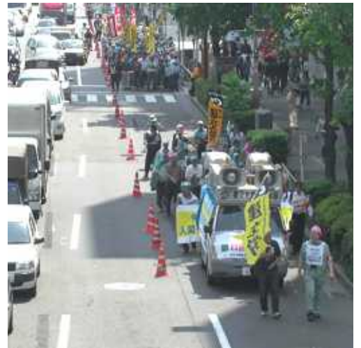
明治公園コースを行進 先導する建交労宣傳カーと延々と続く参加者のみなさん

を取るようになりました。ナショナルセンターがバラバラにメーデーをやるようになってからメーデーの規模が小さくなってきてました。ナショナルセンターのの違いを超え、せめて年に一回、数十万規模のメーデー行進を実現し