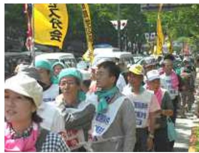
今年の記念品は手ぬぐいでした

たいものです。東京で四〇万、五〇万のメーデーが実現するなら大企業の派遣切り、リストラ合理化や非正規労働者の増大を野放しにしてきた政府に痛打を与えることが出来ます。その時は建交労が掲げる要求も間違いなく前進するでしょう。