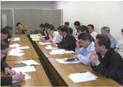
右が要請を聞く厚労省担当、左が要請を提出する労働者です。

か。戦争犯罪は、普通の市民を暴力、強奪、殺戮の加害者と被害者に仕立てあげて、お互いを憎しみのなかにたたき落とす最悪の行為です。