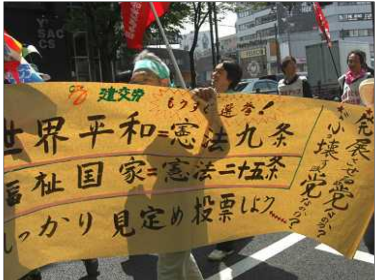
たまたかうメーデーの意気込みを十分に伝える手作り横断幕が登場しました。